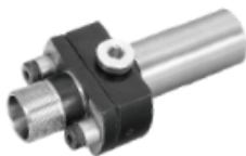
Ausführung AK Version AK