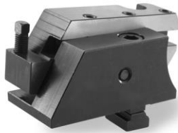
Similar Art.-Nr. 2070110