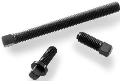
Art.-Nr. 2027200 Art.-Nr. 2027260 Art.-Nr. 2027100