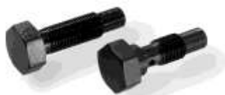
Art.-Nr. 399993 Art.-Nr. 399994