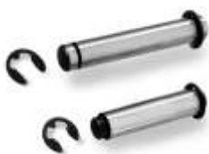
Art.-Nr. 112604 Art.-Nr. 112606

Stifte passend für STAR - SPANNFINGER Pins suitable for STAR - CHUCK LEVER