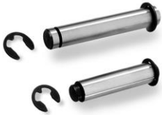
Art.-Nr. 1126040 Art.-Nr. 1226060

Stifte passend für STAR - SPANNFINGER Pins suitable for STAR - CHUCK LEVER